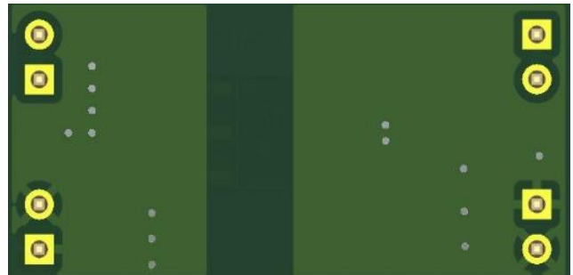
图 3.3 PCB 版图反面 (尺寸: 16 x 33 mm)