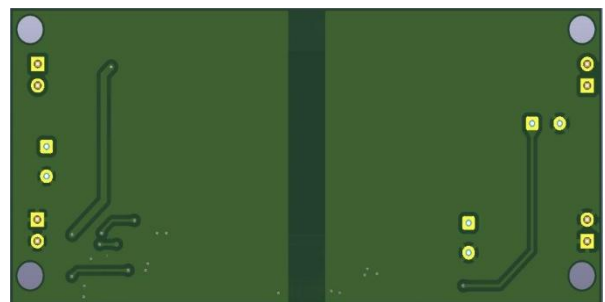
图 3.3 PCB 版图反面 (尺寸: 35x 75mm)