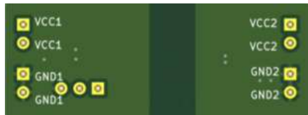
图 3.4 PCB 版图反面