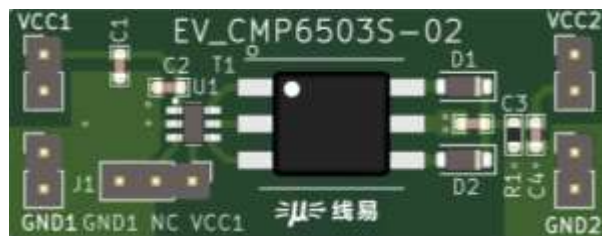
图 3.2 PCB 示意图(尺寸: 16 x 42mm)